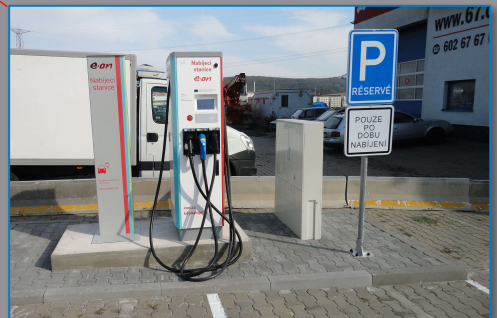
Stanice E.ON, Ostrovačice